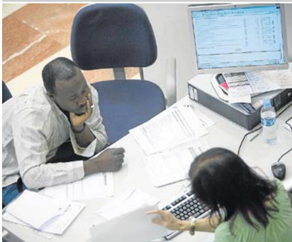
Conviene asesorarse para saber si se tiene derecho al reintegro de cuotas. M. G. CASTRO

El porcentaje a devolver depende de la cantidad por la que superen los 10.752 euros.