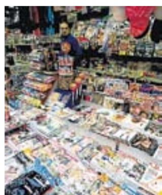
Satisfacción del sector.

25.000 locales de venta de prensa con acceso a la vía pública pueden ya volver a vender tabaco, después de la publicación en el BOE de la Ley Ómnibus. UPTA y la Confederación de Vendedores de Prensa (Covepres) manifestaron su satisfacción por la importante repercusión para el sector.